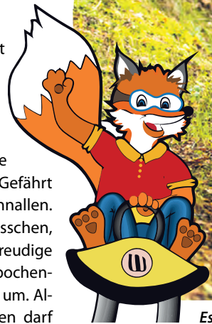
Es kommt schnell auf den Geschmack, wer sich erst einmal getraut hat einzusteigen. Altersgrenze nach oben? Von wegen!

Scharmützelbob Am Fuchsbau 7 15526 Bad Saarow/OT Petersdorf Mo–So 10–18 Uhr (ab Ostern) Juli/August 10–19 Uhr Länge Abfahrt: 650 m Länge Auffahrt: 350 m Fahrzeit: ca. 4 Minuten Kinder: 1 Fahrt 2 €, 6 Fahrten 10 € Tageskarte: 25 €, Geburtsstags-Kinder FREI! Erwachsene: 1 Fahrt 3 €, (6 für 14 €), Tageskarte 35 € www.scharmuetzelbob.de