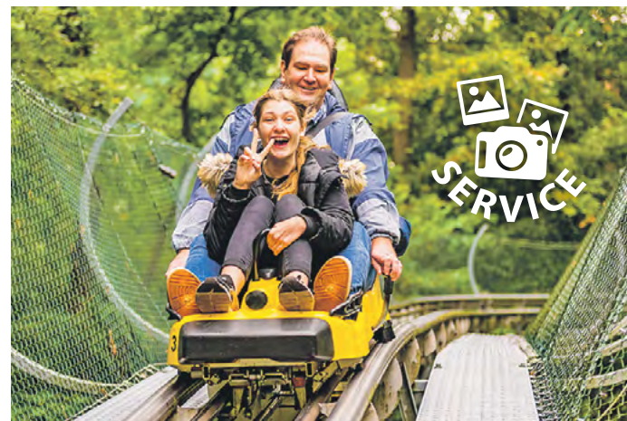
Spätestens in der zweiten Runde weiß man, an welcher Stelle das „Blitzerfoto“ geschossen wird. Keine Sorge: Das ist hier keine Ordnungswidrigkeit.

Lust, mal Gold zu waschen? Schiebt Wettergott Petrus einen feuchten Frusttag, gibt's Regenhäuben für die wilde Partie durch den Wald. Und im Anschluss kann der Spaß drinnen weitergehen. „Wir haben unseren Indoorspielplatz ‚Duellarena‘ renoviert, um