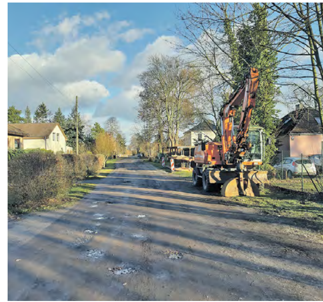
Längst haben die Bagger in der Zosener Prierowsee-Straße mit der Arbeit begonnen.

Privat putzt man regelmäßig seine Wohnung und schaut von Zeit zu Zeit, ob neue Möbel, Gardinen oder ein bequemerer Sofa sein müssten. So ähnlich ist das auch in der Wasserwirtschaft. Mit dem Unterschied, dass in die Jahre gekommene Leitungen und Technik die stabile Rund-um-die-Uhr-Versorgung mit Trinkwasser und die umweltgerechte Entsorgung anfallenden Abwassers gefährden können und schnell ersetzt werden müssen. KMS, MAWV, TAZV, WARL, WAZ und ihr Betriebsführer DNWAB werfen deshalb permanent ein Auge auf den Zustand der Netze und Anlagen. Hier investieren sie in diesem Jahr.