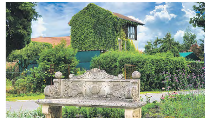
Herrschaftliches Pausieren bei schönster Aussicht – garantiert!

hen: Es gibt kaum einen Ort auf dem Gelände, auf dem Wasser keine Rolle spielt.