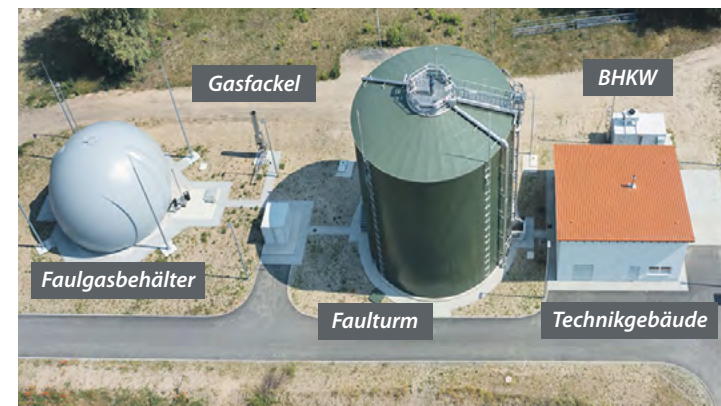
Alles fertig, was „die Faule“ zur Energiebereitstellung braucht.

Die neugebaute Faulungsanlage an der Tandemkläranlage (TKA) Zossen sorgt seit Anfang des Jahres am Standort Wünsdorf dafür, dass die nötige Energie fürs Rechen- und Technikgebäude sowie die Beheizung des Faulbehälters zur Verfügung gestellt werden kann. „Die Faule“ gewinnt aus dem anfallenden Klärschlamm Faulgas, aus dem das angeschlossene