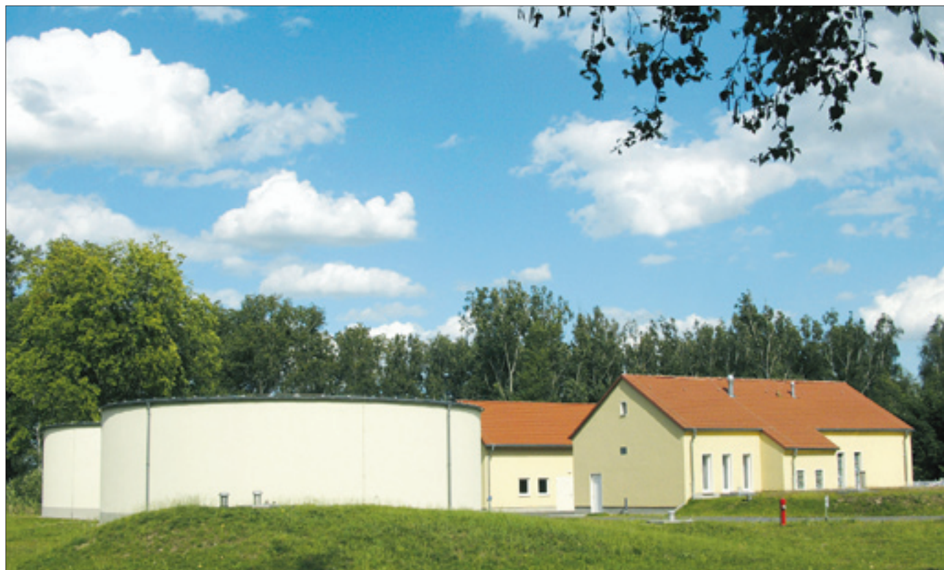
Die Sanierung des Wasserwerkes in Herzberg erfolgte unter Beachtung der demografischen Veränderungen der Region.

Zunächst sind wir Wasserversorger gefordert. Wir müssen die langlebigen und zum Teil überdimensionierten technischen Systeme an den Verbrauchsrückgang anpassen, wobei Ressourcenschutz, Versorgungssicherheit und bezahlbare Gebühren