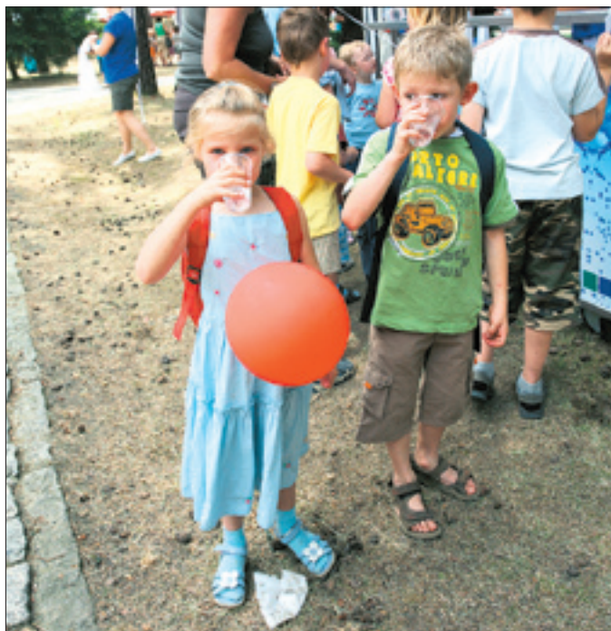
Frisches Trinkwasser schmeckt Kindern besonders gut.

Zur Hausinstallation gehören auch Filter. Sie sind nach DIN 1988-2 bei metallenen Leitungen unmittelbar nach der Wasserzähleranlage einzubauen. Bei Kunststoffleitungen wird ein Einbau empfohlen. Filter sollen den unvermeidbaren Eintrag kleinster Feststoffpartikel in die Hausinstallation unterbinden. Diese Partikel können Korrosionsschäden in Form von Mulden oder Lochfraß hervorrufen. Aber auch Verstopfungen an Perlatoren (Strahlreglern) oder gar Störungen von Armaturenfunktionen können die Folge sein. Damit die Filter ordnungsgemäß funktionieren, müssen