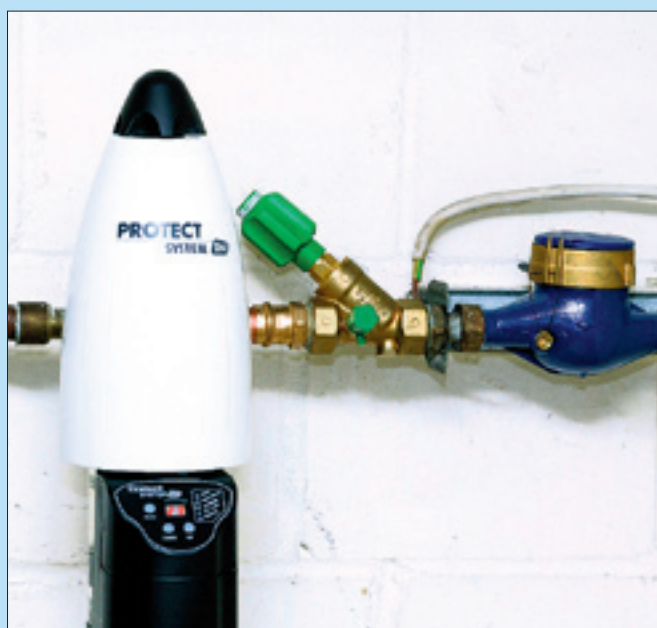
Nach dem Wasserzähler wird der SYR-PROTECT montiert.

Zu den jüngsten Innovationen gehört der SYR PROTECT, der seit März 2007 auf dem Markt ist. Diese kompakte Armatur bietet erstmals eine Kombination von drei wichtigen