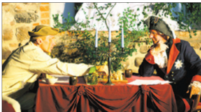
Diesmal huldigen Friedrich der Große und sein Müller nicht dem königlichen Spiel, sondern palavern über die Kartoffel, des Königs liebste Knolle.