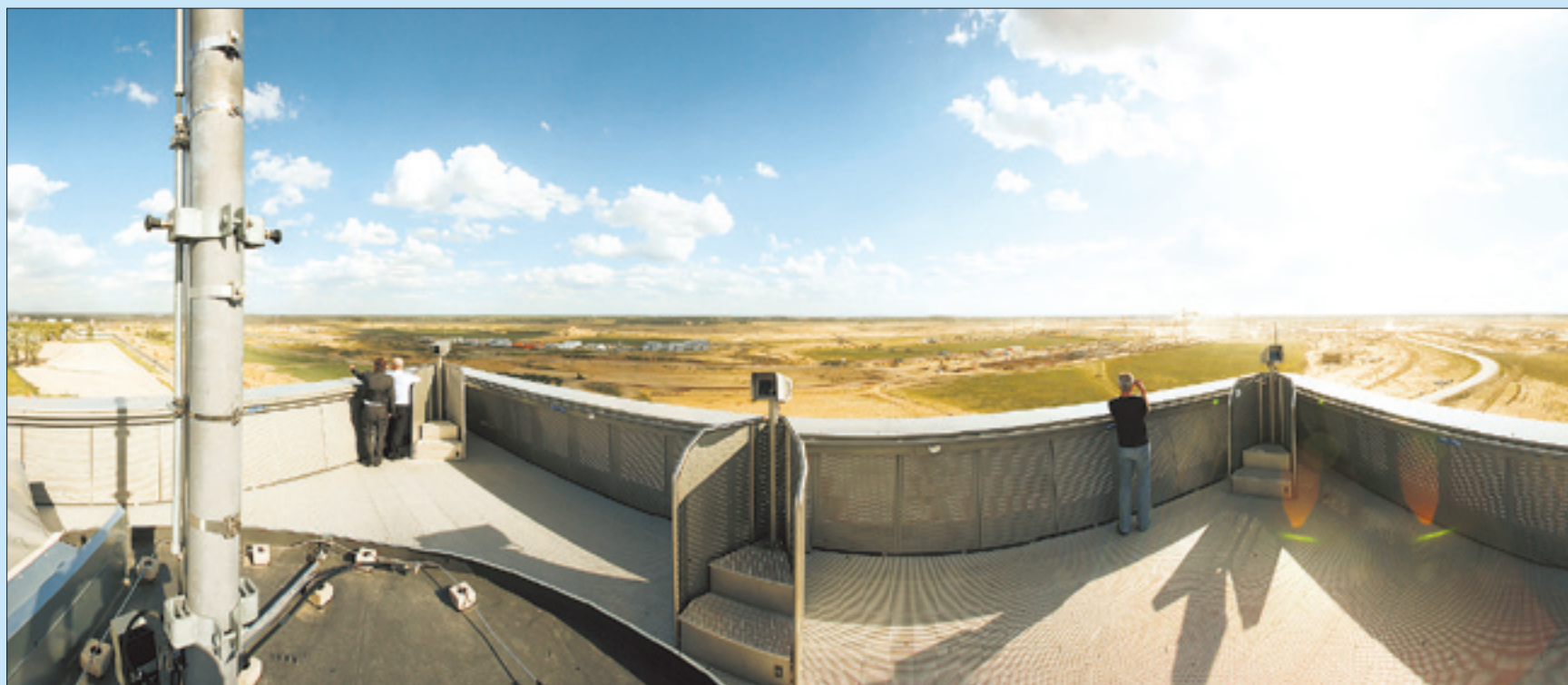
Blick vom Info-Tower des neuen Flughafens auf das zu bebauende Umfeld, für das der MAWV die Infrastruktur bei Trink- und Abwasser zurzeit plant und später realisiert.

Bebauung des früheren Kienberg In diesem Gebiet zwischen Autobahn und Bahntrasse sollen Hotels, Büros und Serviceeinrichtungen entstehen. Um kostengünstig zu planen und bauen, zieht der MAWV die für 2011 geplante zweite 600er Trinkwasser-Versorgungsleitung vom Wasserwerk Eichwalde zum BBI Schönefeld auf der ersten Teilstrecke bis zum ehemaligen Kienberg zeitlich vor. Dieses Vorhaben wird in den Jahren 2008/2009 realisiert. Für die Ableitung des Abwassers haben sich die MAWV-Verantwortlichen etwas Besonderes einfallen lassen. Um erstens Kosten zu sparen, wird die Trasse nicht um