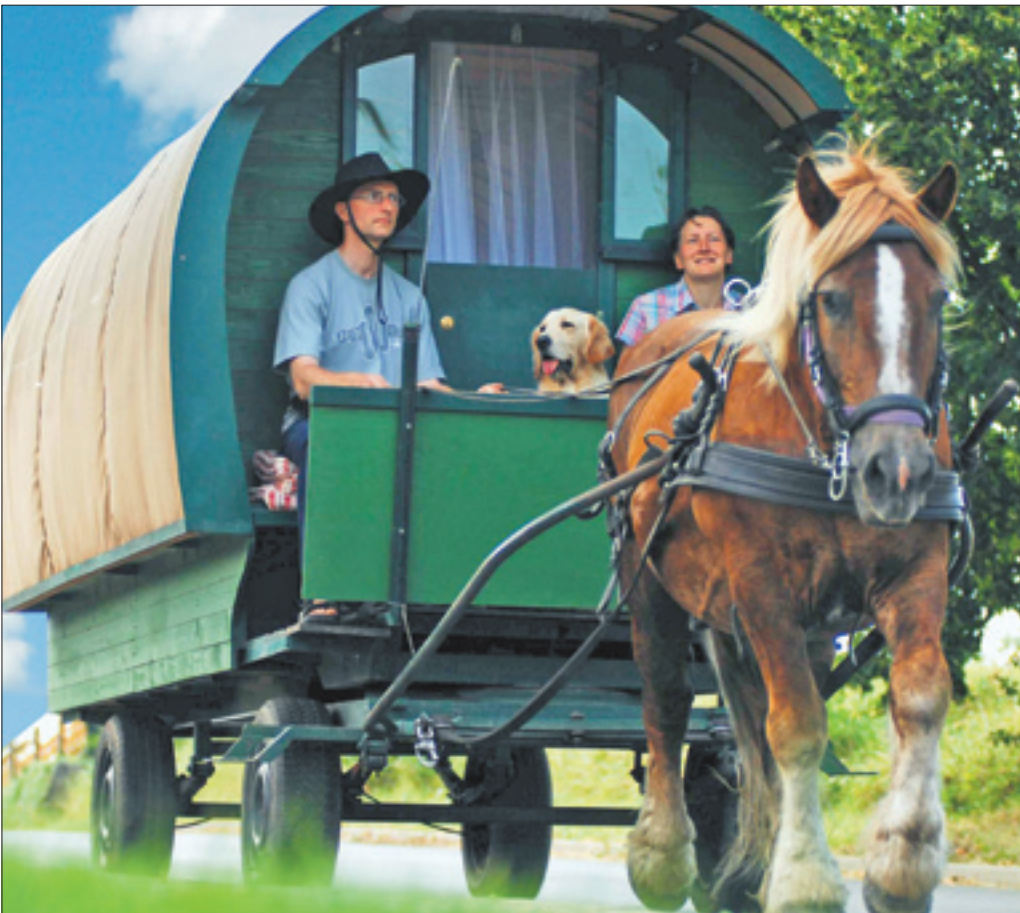
Mit dem Planwagen kann man die reizvolle Uckermark bestens „erfahren“.

Nur eine Pferdestärke, mehr braucht man nicht in der Uckermark, wo die Wege sandig sind und der Himmel weit. Urlaubsglück mal anders: Mit dem Planwagen geht's auf der Sieben-Seen-Tour im Schrittempo von See zu See.