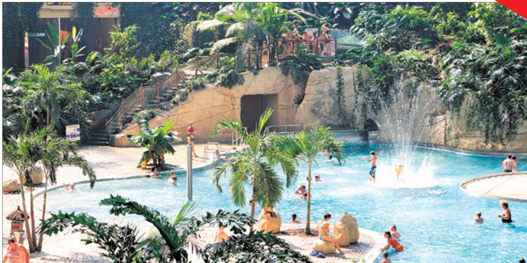
Die Versorgung von Tropical Islands, des bisher größten Kunden des eingegliederten WAVAS, liegt nunmehr in den Händen des MAWV